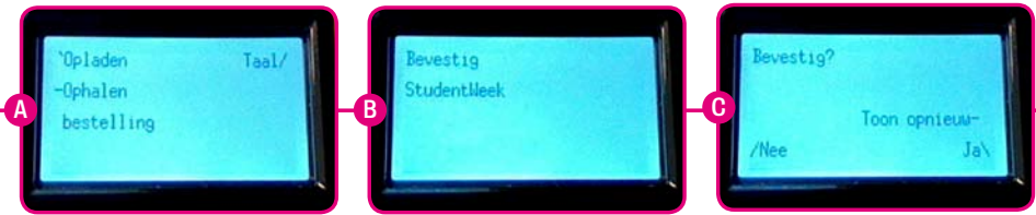
Getoonde beeldscherm kan enigszins afwijken.